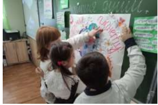
Классный час – «Киноурок «Стеша» Экология души» во 2 классе