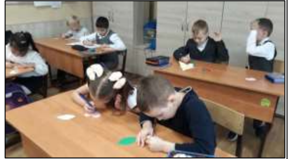
«Киноурок «Стеша» Экология души» в 3 классе